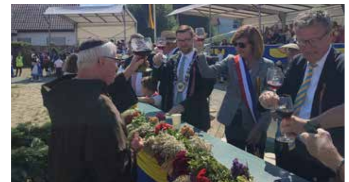
St. Urban stößt jedes Jahr mit den Ehrengästen an