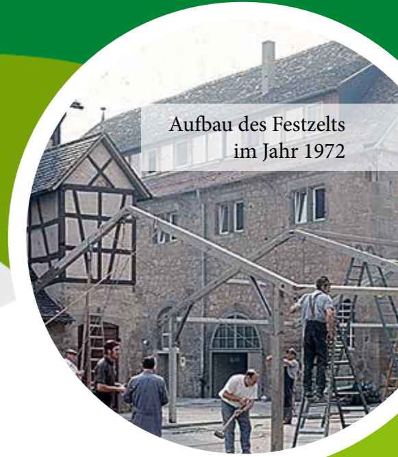
Aufbau des Festzelts im Jahr 1972

Neben selbst zubereiteten Speisen steht hier der Wein- genuss aus dem heimischen Lembergerland im Mittel- punkt. Auch beim historischen Festzug setzt der OWG von Beginn an Akzente: Der aufwendig gestaltete Fest- wagen und die traditionelle Kalebstraube zählen seit über 100 Jahren zu den festen und meistbewunderten Bestandteilen des Umzugs.