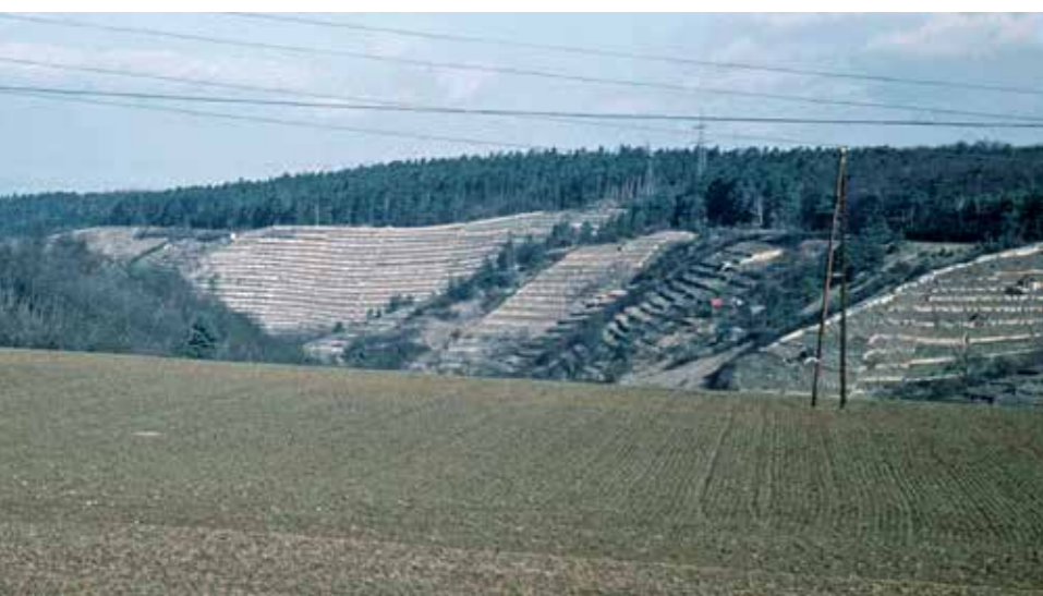
Blick auf die Weinberge im Wannenberg in den 1960er Jahren

Der Weinbau hat in Markgröningen eine lange Tradition. Seine größte Ausdehnung erreichte er im frühen 19. Jahrhundert mit rund 300 Hektar Rebfläche. Nahezu alle geeigneten Hanglagen waren damals terrassiert und mit Reben bepflanzt. Mit dem Auftreten von Rebkrankheiten wie Oidium, Peronospora und der Reblaus sowie durch wirtschaftliche Veränderungen ging die Rebfläche im Laufe der Zeit stark zurück. Heute werden noch rund 30 Hektar bewirtschaftet.