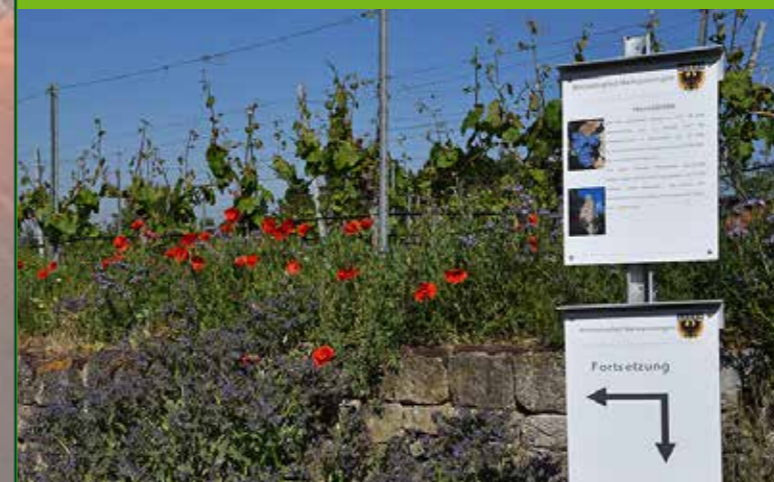
Der Weinlehrpfad wurde im Jahr 2005 errichtet.