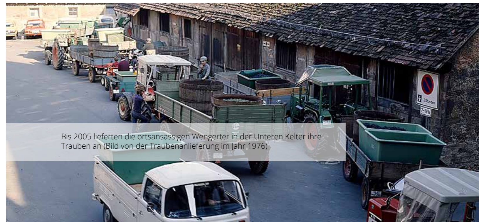
Bis 2005 lieferten die ortsansässigen Wengerter in der Unteren Kelter ihre Trauben an (Bild von der Traubenanlieferung im Jahr 1976)

Trotz dieser strukturellen Veränderungen ist eines geblieben: die enge Verbindung der Markgröninger Wengerter zu ihren Weinbergen und die hohe Qualität der Trauben.