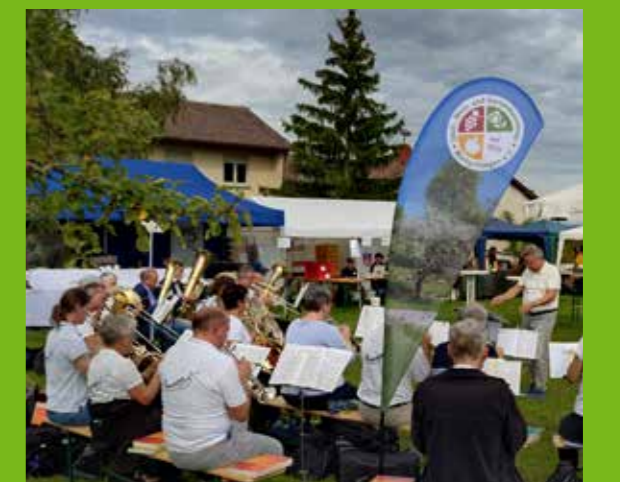
Tag des Weinbergs 2025 mit dem Posaunenchor beim Gottesdienst