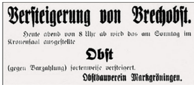
Obstbauverein Anzeige in Mg. Zeitung 1926

nachhaltig das charakteristische Streuobst-Landschaftsbild, das bis heute zu den bedeutendsten in Baden-Württemberg zählt. Bereits ein Jahr später, am 12. März 1927, erfolgte der Zusammenschluss zum gemeinsamen „Obst- und Weinbauverein“.