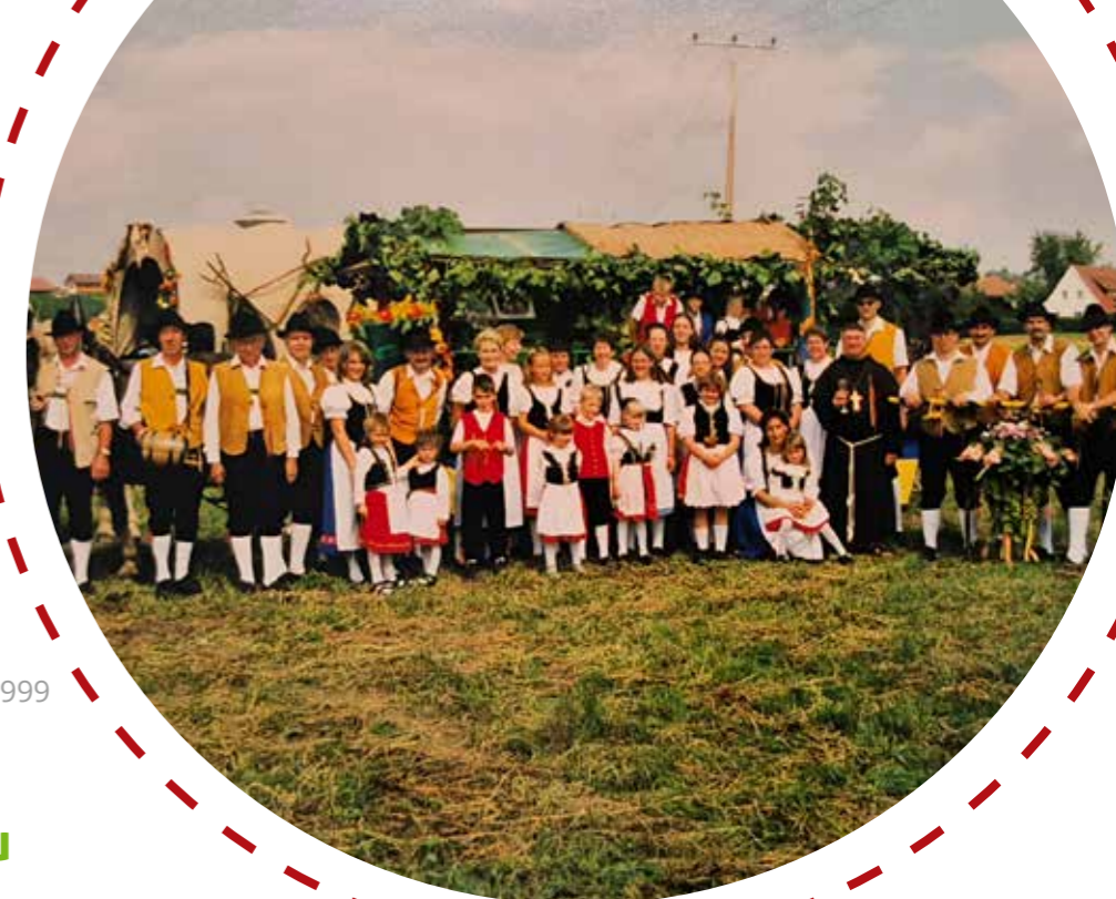
Bild: Festzuggruppe Schäferlauf 1999