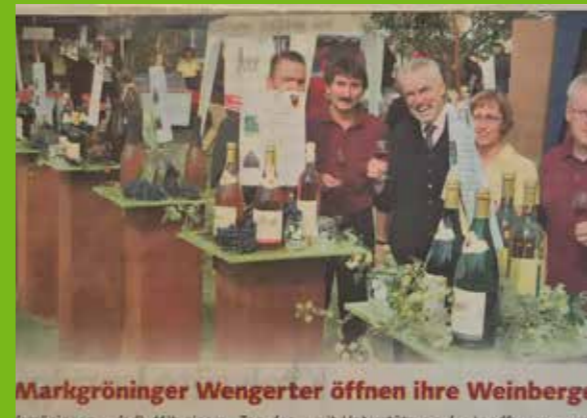
Nach der Fusion der Weingärtnergenossenschaft Markgröningen mit der Genossenschaftskellerei Rosswag-Mühlhausen organisierte der OWG im Jahr 2007 den ersten Tag des Weinbergs.